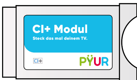
PÝUR CI+ Modul