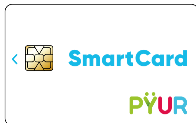
SmartCard mit Ihrer persönlichen Jugendschutz-PIN

Auf der Rückseite dieser Anleitung erfahren Sie alles über die technischen Voraussetzungen.